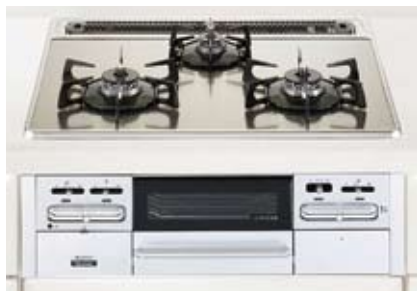
※CENTRO セントロ・CLEANLADY クリンレティの2機種対象